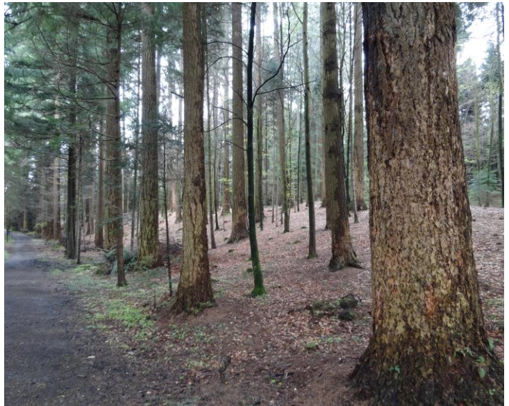
Diese Douglasien-Bäume werden wir sehen, sie sind 100 – 170 Jahre alt!

Wir haben eine leichte und abwechslungsreiche Wanderung ausgesucht, welche auch für Kinder und ältere Knüsel leicht zu bewältigen ist.