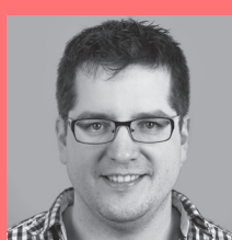
REGIE Benno Inderbitzin